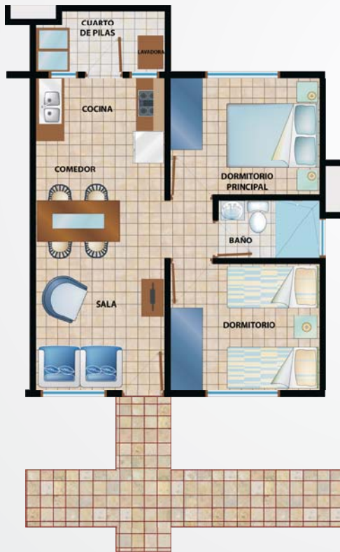
Modelo 2 dormitorios