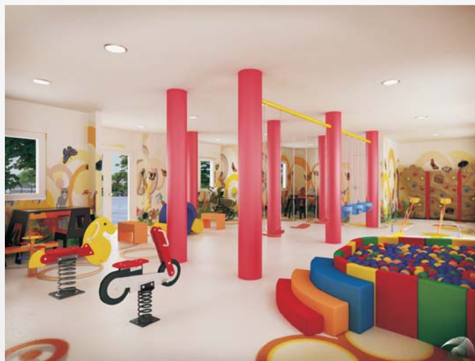
Juegos infantiles bajo techo