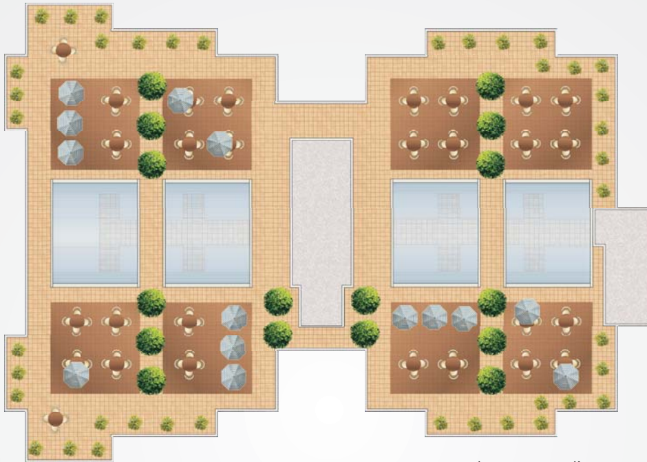
Area recreativa en azotea