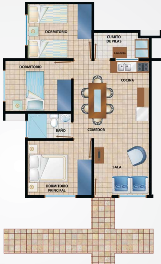
Modelo 3 dormitorios